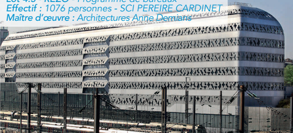
Lot 4.3 - REZO - Programme de bureaux Effectif : 1076 personnes - SCI PEREIRE CARDINET Maître d'œuvre : Architectures Anne Demians