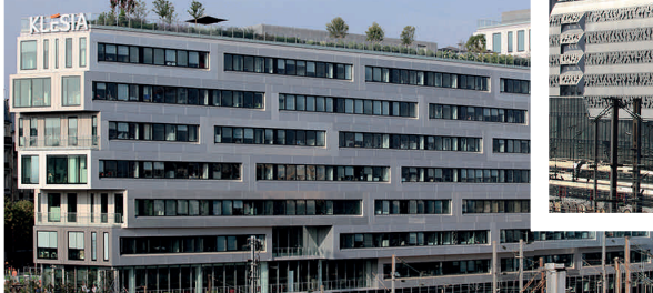
Lot 4.1 - STRATO - Programme de bureaux Effectif : 877 personnes - SCI PEREIRE CARDINET Maître d'œuvre : Harel et Le Bihan